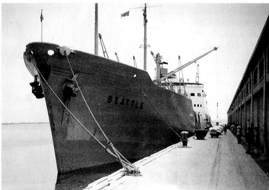
T.v. ses SEATTLE vid kajen i Cartagena, Col, där lossning och lastning första slussar för att så småningom nå Stilla Havet.