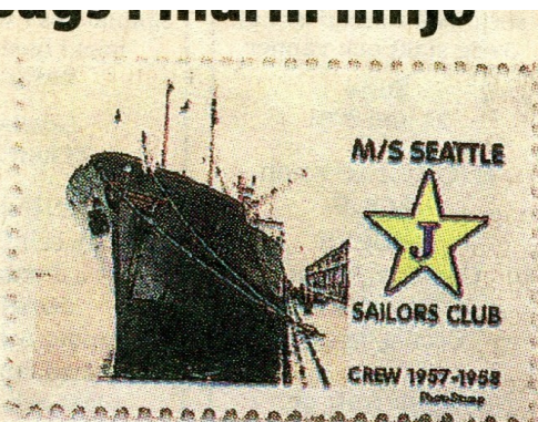
RÄTTA MÄRKET. Detta är Seattleklubbens eget frimärke.