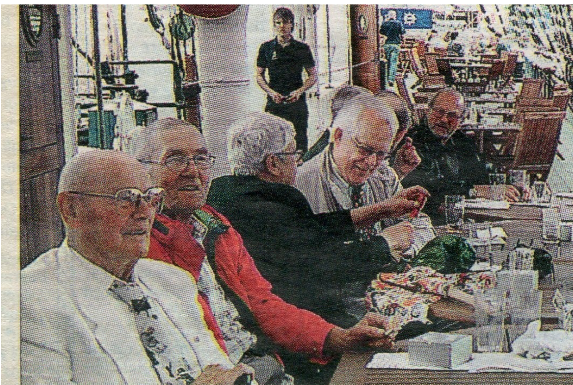
LUGNARE VATTEN. Det här gänget har varit med om stormar svåra